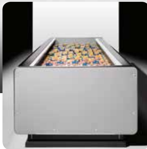
Super Madrid 3

Les îlots réfrigérés Madrid 3 et Super Madrid 3 se placent dans la tranche des produits utilisés dans les différentes typologies de points de vente, avec un penchant naturel au genre « Discount ».