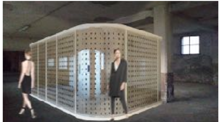
13_cocoon beauty area