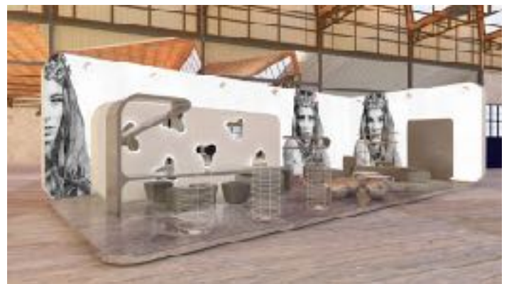
5_warming space hall